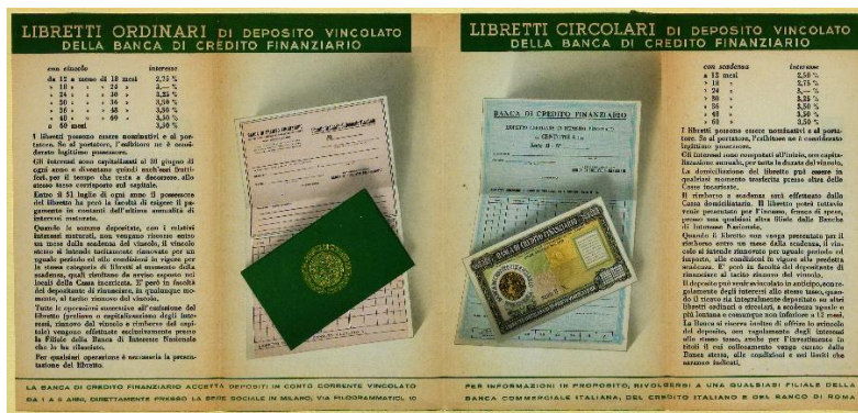
Volantino pubblicitario per la sottoscrizione dei libretti di deposito

Nel 1956 le partecipazioni sono in Assicurazioni Generali, Bastogi, Fondiaria, Montecatini e SADE e in alcune finanziarie di settore dell'IRI. La presenza nel capitale di queste società è funzionale all'attività di una banca d'affari, chiamata anche a dare stabilità di prospettive ai capitali di comando di imprese societarie di cui curava operazioni straordinarie, come fusioni e aumenti di capitale, emissioni di obbligazioni ed emissioni di altri titoli di credito. Le contropartecipazioni dei principali gruppi clienti, che avrebbero preso forma nel tempo con la progressiva riduzione delle quote in capo alle banche azioniste, avevano invece due fini: quello di essere reciprocamente interlocutori privilegiati nello studio e nell'attuazione di programmi di finanza societaria e quello di rendere autonoma la stessa Mediobanca facendo “pesare” anziché “contare” le azioni possedute, citando la celebre frase attribuita ad Enrico Cuccia. L'opinione di quegli anni era che la presenza di Mediobanca nel capitale sociale delle aziende, affiancando di fatti l'imprenditore, non solo avrebbe garantito all'azienda un apporto di capitale, ma avrebbe altresì consentito alla stessa di rivolgersi con maggiore autorevolezza ai mercati finanziari e borsistici, garantendo nello stesso tempo al gruppo di comando il controllo delle imprese.