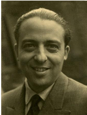
Ritratto di Enrico Cuccia realizzato da Antonello Gerbi, Eastbourne, 1947

Per avviare la sua funzione di credito a medio termine, con una maturità massima di cinque anni, Mediobanca inizierà a proporre libretti vincolati e certificati di deposito in cui confluirà il risparmio che le famiglie italiane avevano iniziato ad accantonare dopo la fine della guerra. Lavoreranno in questo senso gli sportelli delle tre banche