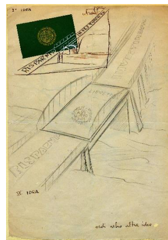
Bozzetto pubblicitario: Mediobanca, un ponte sicuro tra risparmio e investimenti

Mediobanca sarebbe presto diventata la prima banca d’affari della neonata Repubblica, il “centauro” che Cuccia avrebbe evocato in seguito (in un’audizione al Senato, nel 1978), metà pubblico e metà privato, secondo una natura che la caratterizza fin dalle sue origini e per molti anni: soggetto di mercato, che si finanzia sul mercato ed è tenuto al riparo dalle influenze della politica, eppure nato per iniziativa delle banche controllate dall’IRI 3 , nonché un istituto di credito che per decenni sarebbe stato anche la holding di partecipazioni al centro di uno sviluppo industriale forse intuito dai banchieri protagonisti di quella fase, eppure imprevedibile