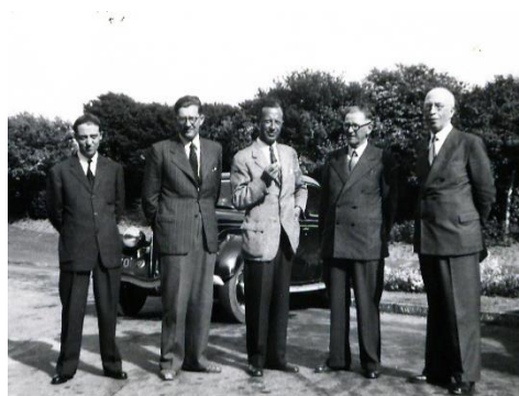
Viaggio di Enrico Cuccia (primo da sinistra) a Eastbourne nel 1947

Spicca il nome di André Meyer, banchiere francese di Lazard New York, legato a Cuccia da un rapporto di amicizia e di stima. "Accanto a lui emergono altri importanti riferimenti", scrive Farese, tra cui David Eli Lilienthal, l'ex presidente della rooseveltiana Tennessee Valley Authority che negli anni Cinquanta visita, grazie a Mediobanca, il Mezzogiorno d'Italia e Jean Monnet, uno dei padri del processo di integrazione europea.