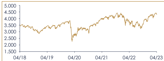
ANDAMENTO INDICE EURO STOXX 50: ULTIMI 5 ANNI